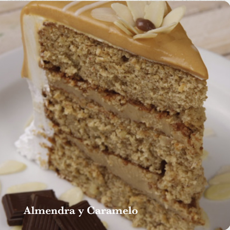
Almendra y Caramelo