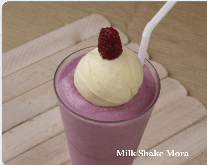
Milk Shake Mora

Mora, Fresa, Chocolate, Vainilla y Oreo. ¢2.950