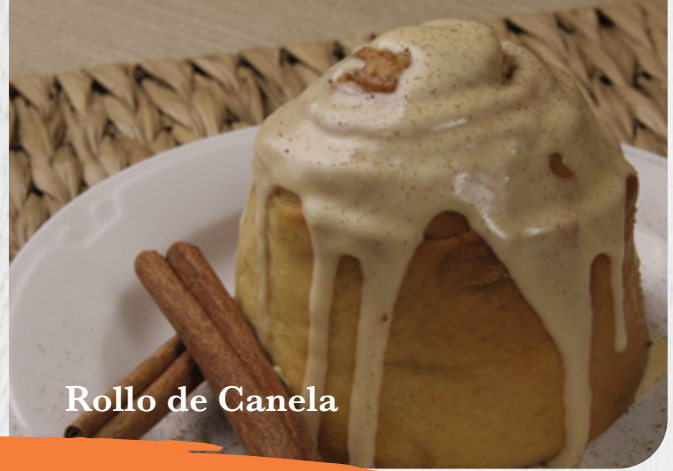
Rollo de Canela