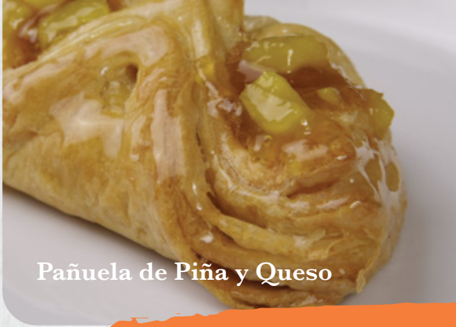
Pañuela de Piña y Queso