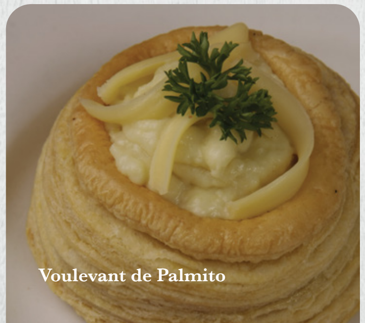
Voulevant de Palmito