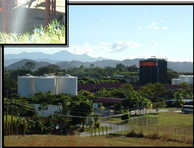
Fotografías 6 y 7. Agroindustria instalada en el cantón de Grecia.

De esta forma, y de acuerdo con la Comisión de Autodiagnóstico Comunitario, podemos decir que la agricultura mantiene el lugar preponderante dentro de los sectores productivos del cantón ocupando un 43.74% de los trabajadores, concentrados principalmente en los distritos Bolívar y San José. Continúa en orden de importancia los servicios comunales, sociales y personales, que absorben casi el 20% de la fuerza de trabajo (Grecia Centro, San Isidro, San Roque). Y en tercer lugar se sitúa el sector de la industria manufacturera ubicándose en ella casi el 10% de la población activa, y desarrollada principalmente en los distritos de Grecia Centro, Puente Piedra y San Roque (Comisión de Autodiagnóstico Comunitario, Pág.26).