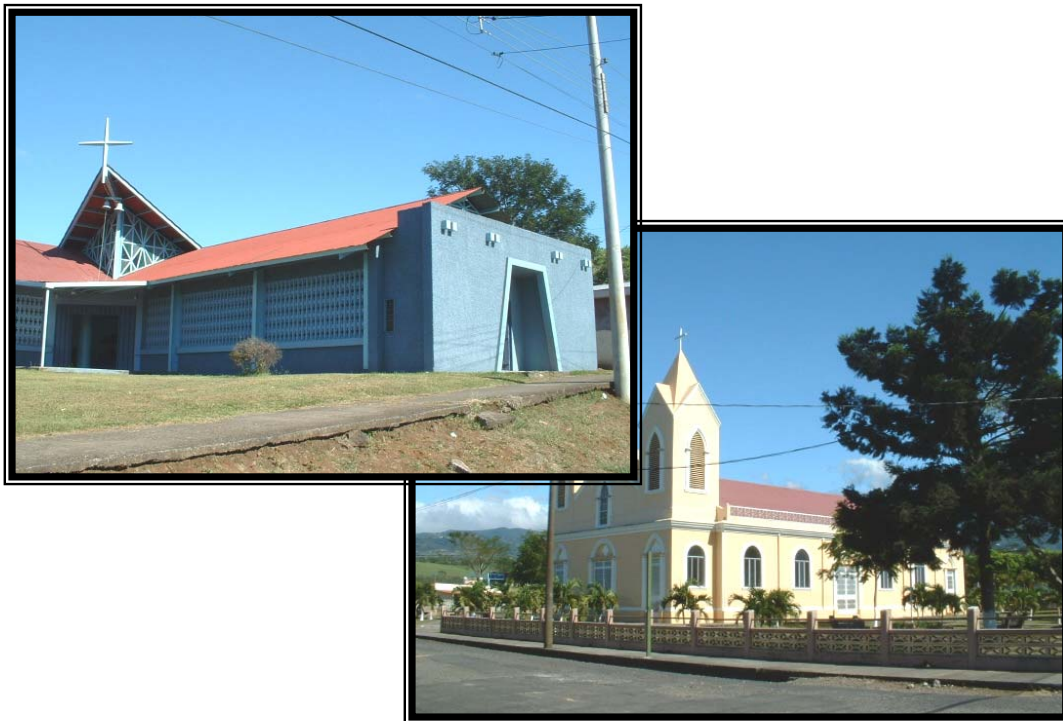
Fotografías 12 y 13. Templos católicos que forman parte de la riqueza cultural y arquitectónica del cantón de Grecia.

La monumentalidad en las edificaciones religiosas y los edificios públicos, se unen con la actitud de los griegos con respecto a la conservación, la transformación y la configuración de su espacio. El contar con un legado arquitectónico que de cuenta de su memoria física y cultural ha sido clave.