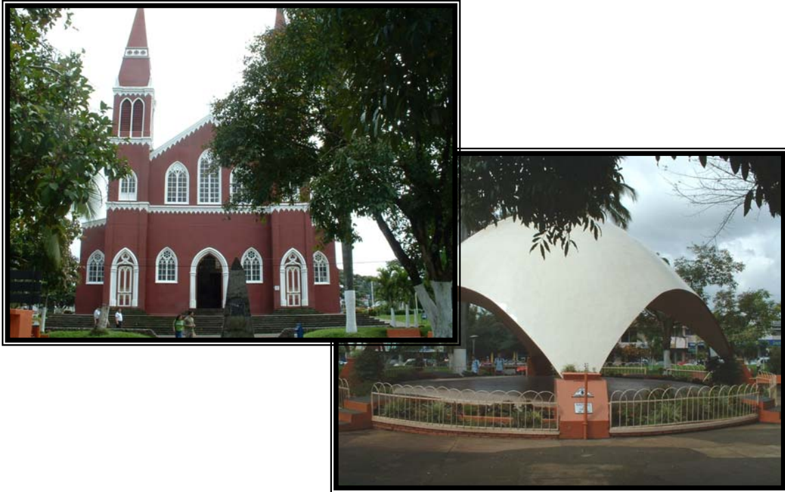
Fotografías 10 y 11. Vistas del centro de la ciudad de Grecia, Parque Central.