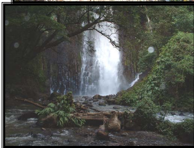
Fotografías 8 y 9. Catarata en el sector de Los Chorros y el Puente de Piedra que da el nombre a uno de los distritos.