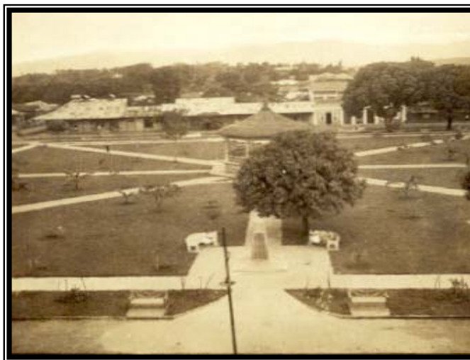
Fotografías 1 y 2. Vista del Parque Central de Grecia y del antiguo edificio municipal.

Durante este lapso, las nuevas demandas domiciliarias y el aumento de la actividad industrial en el cantón, obligaban a una potencia eléctrica mayor, ya no solo se necesitaba el alumbrado público, sino también calefacción y servicio de fuerza motriz. La Municipalidad decide, entonces, instalar una nueva planta hidroeléctrica de 90 a 100 caballos de fuerza, cuya construcción y puesta al servicio público, se desarrollará entre 1915 y 1918.