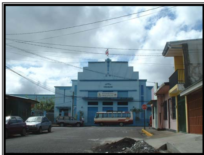
Fotografía 5. Escuela Simón Bolívar.

Para ese mismo año, la escuela se traslada a un local más amplio y cómodo, el cual tuvo que ser desalojado entre los años 1858/59 para establecer ahí un hospital provisional. Más tarde – en 1872 – el importante incremento en la matrícula lleva al cabildo a adquirir un edificio propio para la escuela; comprándose una casa amplia en el vecindario.