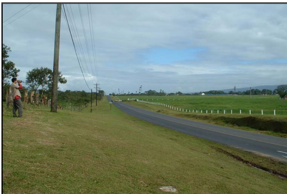
Ilustración 11. Muestra de las grandes extensiones de pasto características del distrito de Río Cuarto.