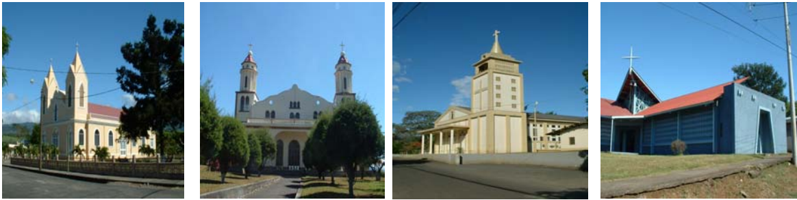
Ilustración 13. Iglesia de Santa Gertrudis Norte. Iglesia de San Roque. Iglesia de Rincón de Salas. Iglesia de Tacaes.