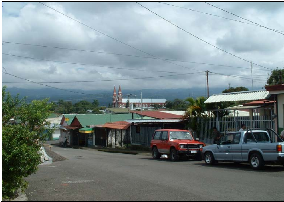
Ilustración 7. Paisaje urbano, distrito central de Grecia.

Este paisaje esta constituido indiscutiblemente por el núcleo urbano de la ciudad de Grecia y sus alrededores inmediatos, donde se presenta la mayor concentración de población de todo el cantón.