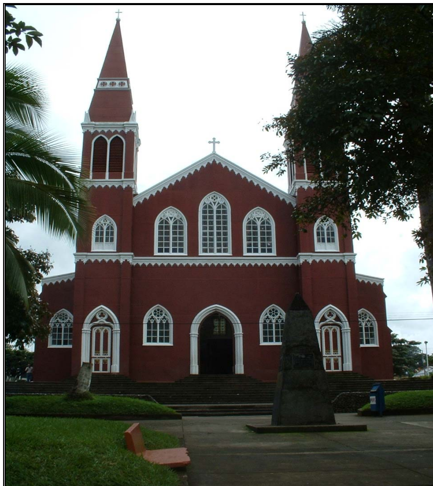
Ilustración 4. Iglesia Católica de la ciudad de Grecia y vista parcial del parque.