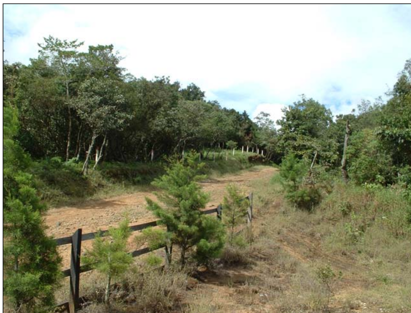
Ilustración 2. Sector de la reserva forestal de Grecia.

Las vías de acceso a los diferentes puntos de la Reserva Forestal se encuentran en malas condiciones, en donde es necesario en algunos de los sectores ingresar con vehículos de doble tracción. Estas vías son de tierra y lastre, que sumadas a las lluvias hacen que el camino se vuelva difícil de transitar.