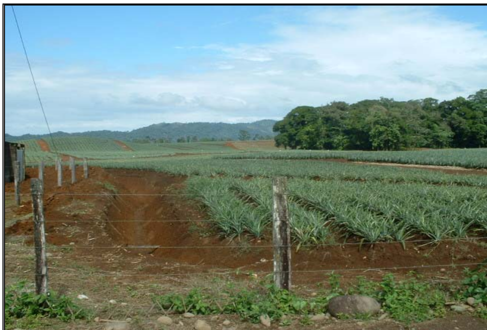
Ilustración 10. Paisaje agrícola del distrito de Río Cuarto con presencia de cultivos de piña

destacándose la actividad agropastoril con presencia de cultivos como piña, yuca y grandes extensiones de pasto como se muestra en la ilustración 8 y 9.