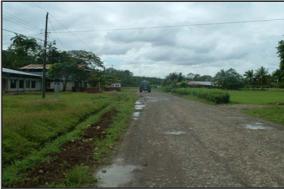
Ilustración 8. Paisaje rural, Río Cuarto

De acuerdo con las observaciones llevadas a cabo en el cantón, se ha podido determinar que el paisaje rural se localiza principalmente hacia el norte de la ciudad de Grecia, con predominio hacia las partes altas cercanas a la cima del Volcán Poás.