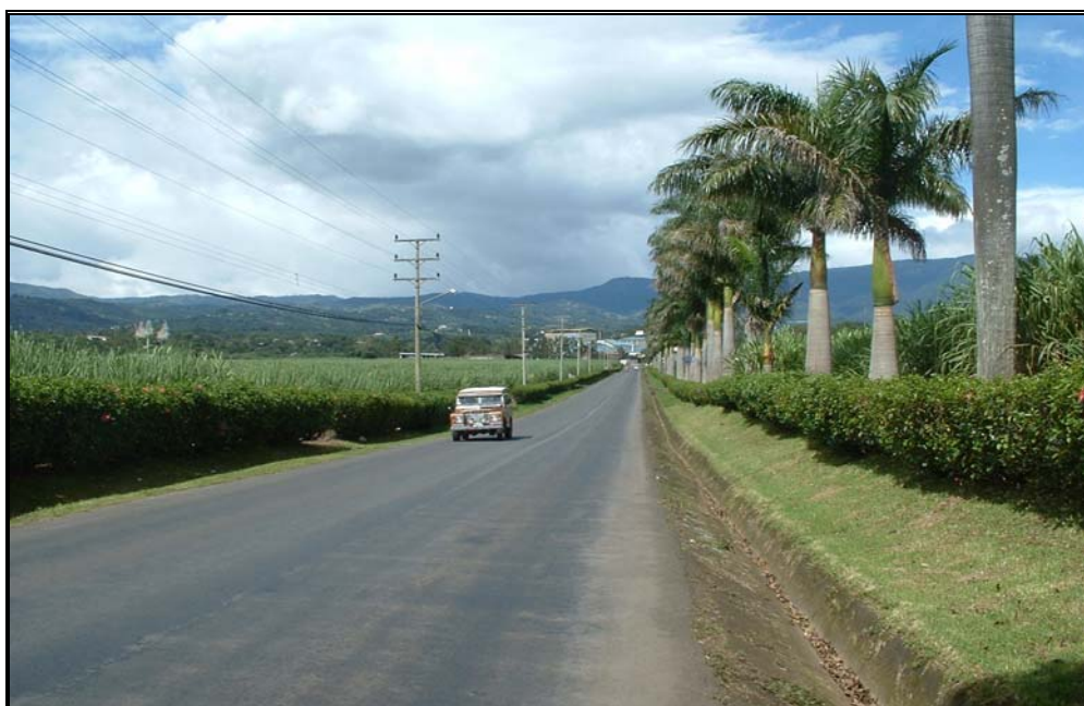
Ilustración 9. Paisaje agrícola representativo de la parte noreste de la ciudad de Grecia

El paisaje agrícola es característico de aquellos sectores hacia el norte de la ciudad de Grecia donde predominan cultivos de Café y Caña; así como hacia el sur de la misma ciudad, con grandes extensiones de cultivos mayoritariamente de Caña como se muestra en la ilustración 7.