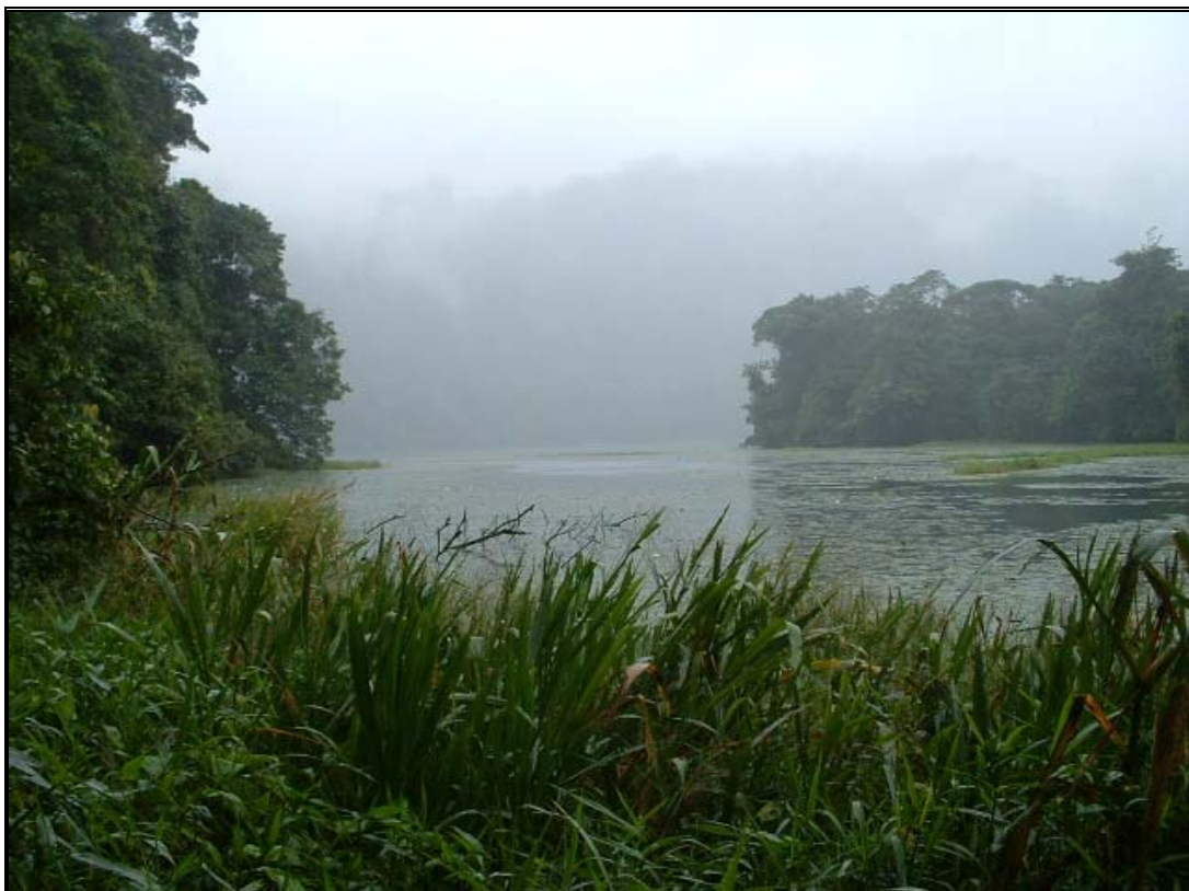
Ilustración 6. Laguna de Hule donde se muestran las características de vegetación abundante que la rodea