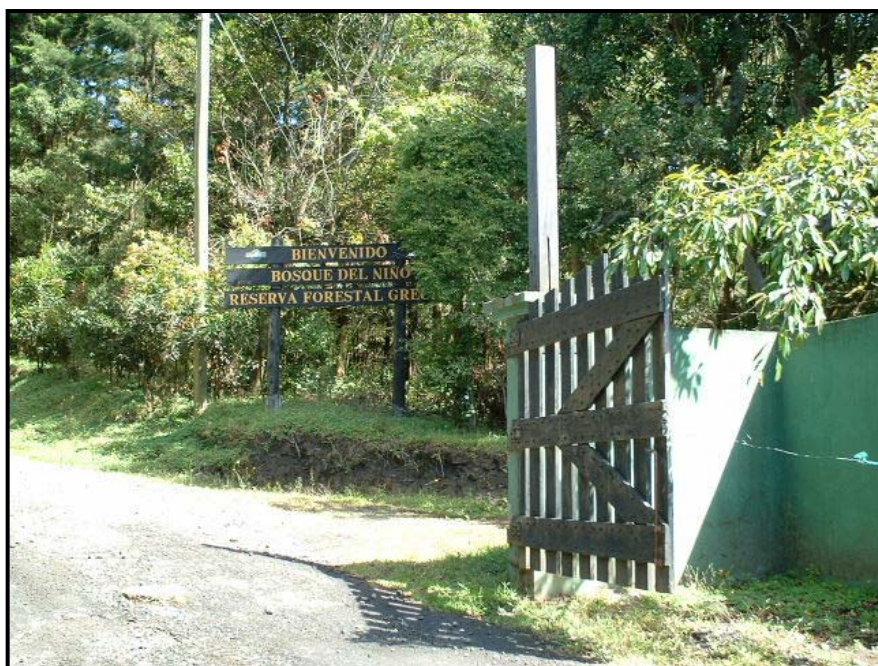
Ilustración 3. Entrada al Bosque del Niño, reserva forestal de Grecia.

En la zona existe mucha tranquilidad debido a que se encuentra alejada de centros urbanos, lo que convierte a Bosque del Niño en un lugar ideal para dejar de lado por un momento el estrés y la cotidianidad de la ciudad.