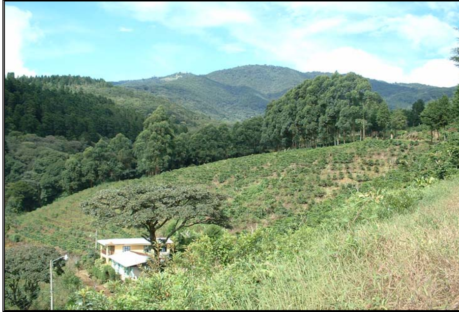
Ilustración 2. Combinación entre el paisaje agrícola con cultivos de café y el paisaje de bosques y montañas de la Reserva Forestal de Grecia

Los diferentes tipos de paisaje del cantón de Grecia, están complementados con un elemento arquitectónico que ha llamado mucho la atención para este análisis, que son las iglesias que se encuentran en cada uno de los sitios que han sido visitados.