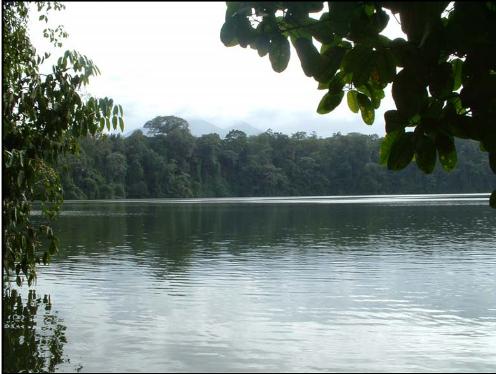
Ilustración 5. Laguna de Río Cuarto, donde se muestra la belleza de la vegetación circundante